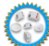
OPTIONAL LIGHT/MOTION DETECTOR

Pannello LED / LED panel light Panele oświetleniowe LED / LED - Leuchtplatte