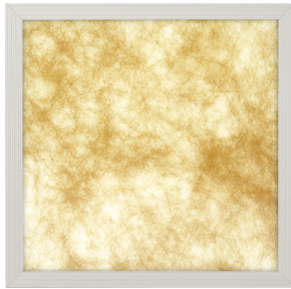
Art Line Pattern