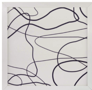
Pattern Film NOT Included